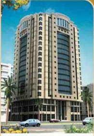
Remel Ravza Sarayı

Servisli, Bütün Odalar Özel Tuvalet - Banyolu